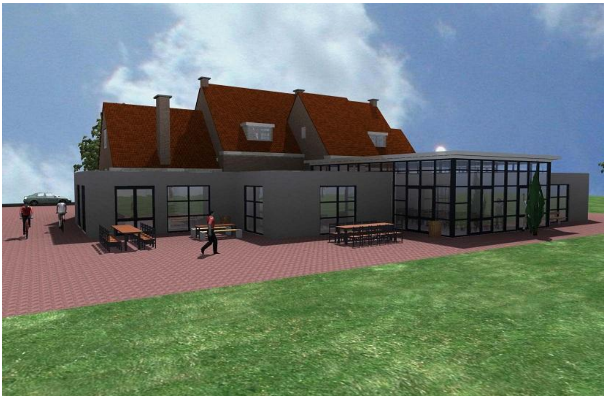
Elckerlyc; sfeerimpressie achterzijde met terrasmogelijkheden