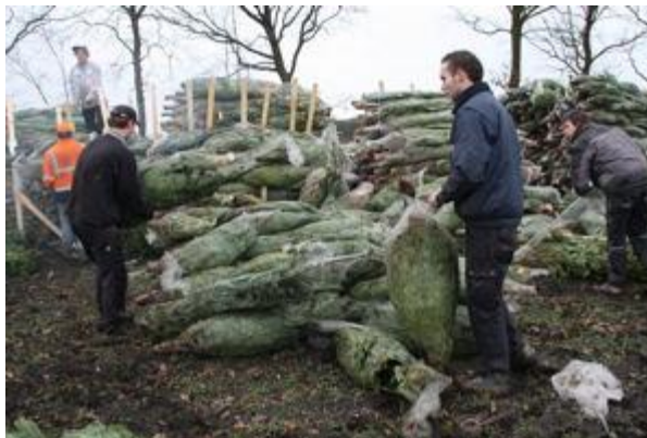
Elckerlyc; Aksie en de bezigheden met de jeugd van Luttenberg