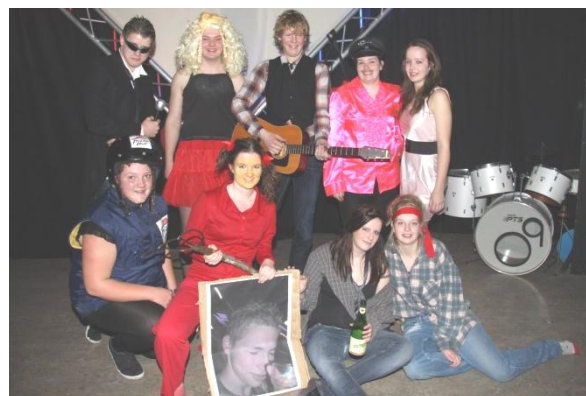
Elckerlyc; de jaarlijkse Bazar met de Play-back Show; voor jong & oud