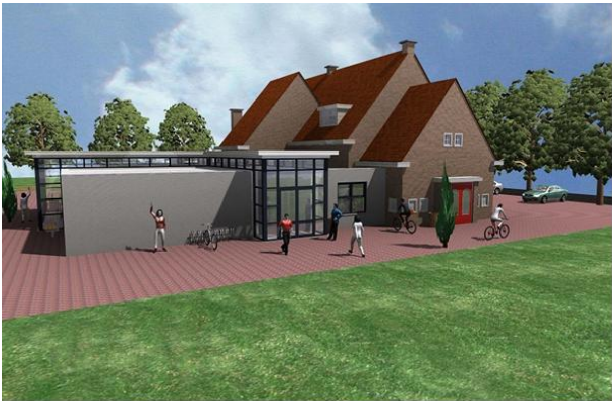
Elckerlyc; aanbouw met nieuwe entree en culturele open oefenruimte