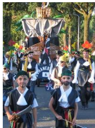
Elckerlyc, als organisatie binnen Luttenbergs feest