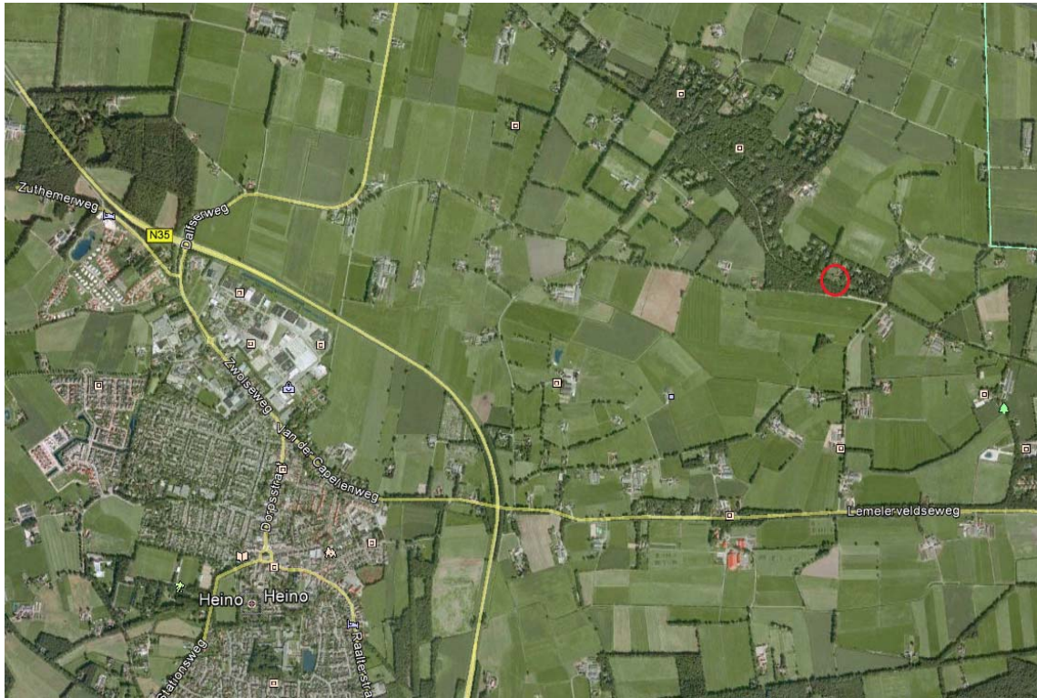
Figuur 1.1. Globale ligging plangebied