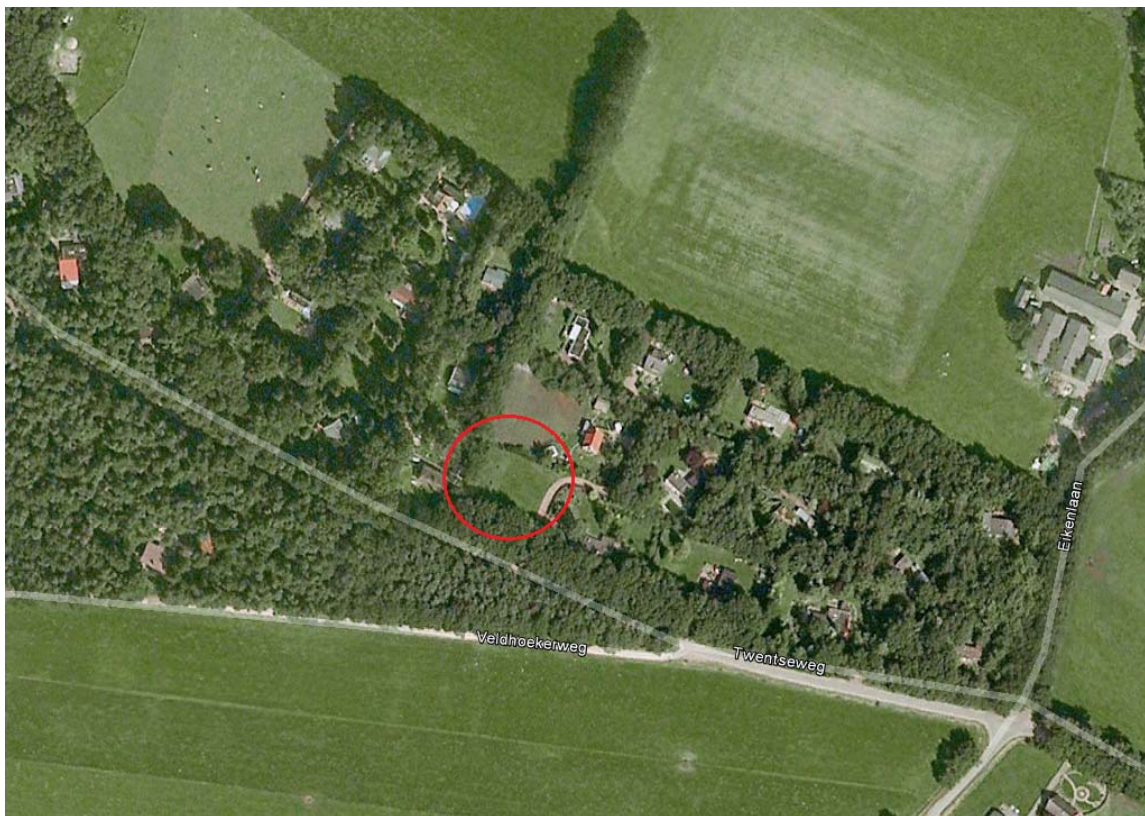
Figuur 1.2 Ligging plangebied