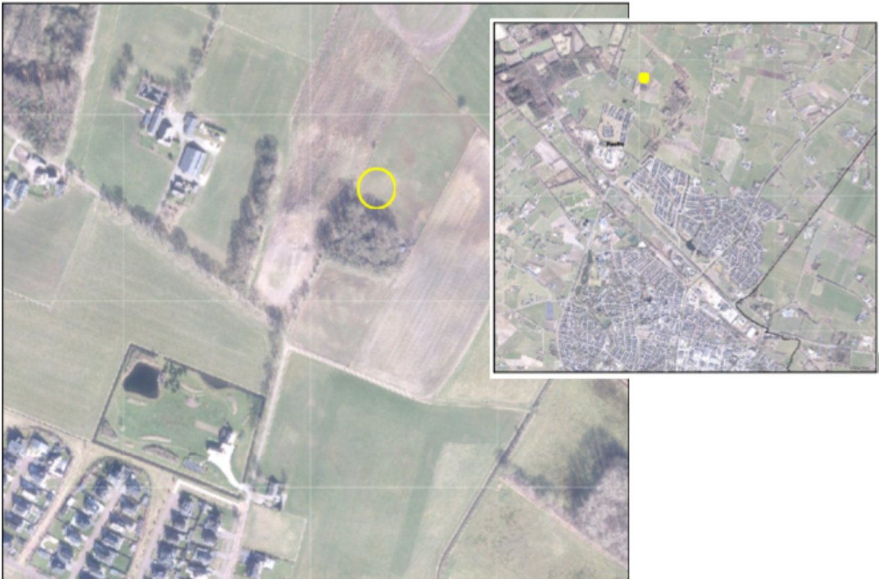
Afbeelding 1: locatie Knapenveldsweg tussen 14 en 16

Het perceel aan de Knapenveldsweg is in het bezit van de initiatiefnemers en deze gebruiken het nu deels als paardenweide. Er staan tevens meerdere gebouwtjes waarvoor geen vergunning is afgegeven. Met uitzondering van één gebouwtje (16 m 2 ) worden deze allemaal verwijderd. Het deel van het perceel waar de woning met bijgebouwen is voorzien heeft nu nog een agrarische bestemming. Deze wordt omgezet naar Wonen. Hierbij gaan inhoudelijk dezelfde regels gelden als nu bij de reguliere woonbestemming van toepassing is in het bestemmingsplan Buitengebied. De nieuwe woning wordt landschappelijk ingepast (zie afbeelding 2) en het bestaande bosje behoudt de natuurbestemming en wordt zelfs groter. In een straal van 20 meter zijn op de agrarische gronden rondom de woonbestemming het gebruik van gewasbeschermingsmiddelen uitgesloten. Deze gronden vormen daarmee ook onderdeel van dit ontwerp Tam-Omgevingsplan (zie afbeelding 3).