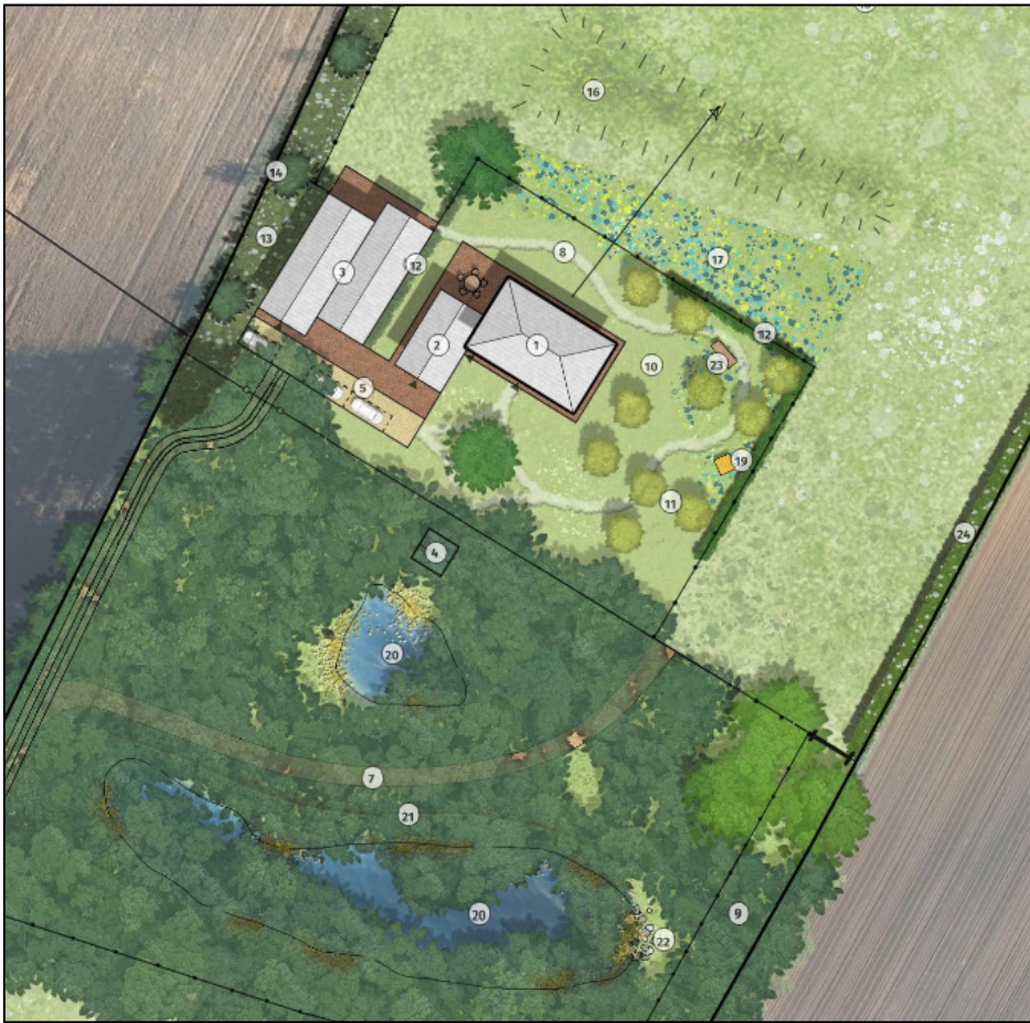
Afbeelding 2: landschappelijk inpassingsplan