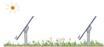
tracker - maximale stand namiddag