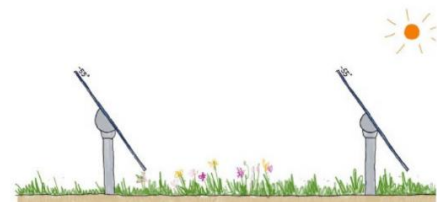
tracker - maximale stand ochtend

Het betreft hier nog een aanvraag onder de Wabo, waarbij een procedure gevoerd moet worden om van het geldende bestemmingsplan af te wijken. De gronden waar de zonnepanelen worden geplaatst hebben namelijk de bestemmingen "Agrarisch" en "Agrarisch met waarden", waarbinnen dit strijdig is.