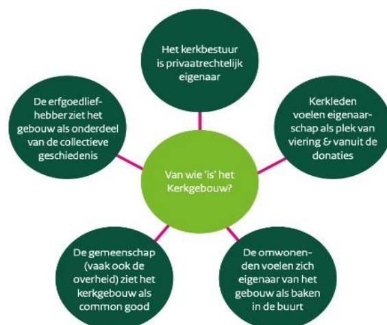
Figuur 3.1 Verschillende perspectieven op kerkgebouwen.

Kerkbesturen zijn de juridische eigenaren van religieus vastgoed. Het belang en de waarde die verschillende stakeholders hechten aan religieuze gebouwen is (veel) breder dan de formele rol, namelijk het houden van religieuze bijeenkomsten. Kerken vervullen naast een religieuze, voor veel mensen, ook een maatschappelijke functie: ze bieden ruimte voor ontmoeting en vormen een herkenningspunt in een dorp of stad. RCE heeft die verschillende betekenissen voor de verschillende stakeholders weergegeven in bijgevoegde figuur.